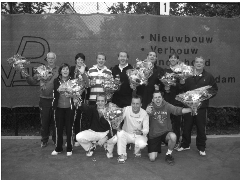
De kampioensteams gehuldigd.